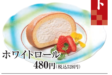
ホワイトロール 480円(税込528円)

Häagen-Dazs with KORA バニラ グリーンティー 各500円(税込550円)