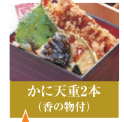
かに天重2本 (香の物付)