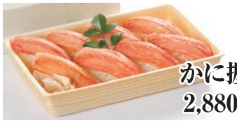
かに握り(8貫) 2,880円(税込3,110円)