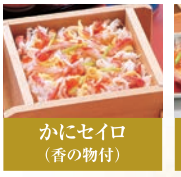
かにセイロ (香の物付)