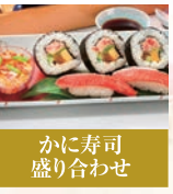
かに寿司 盛り合わせ