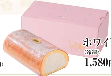
ホワイトロール (冷凍) 1,580円(税込1,706円)