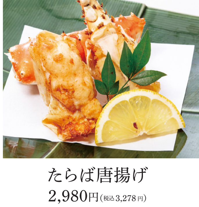
たらば唐揚げ 2,980円(税込3,278円)