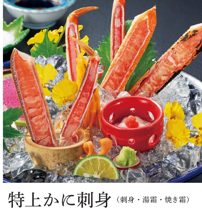
特上かに刺身 (刺身・湯霜・焼き霜) 2,980円(税込3,278円)