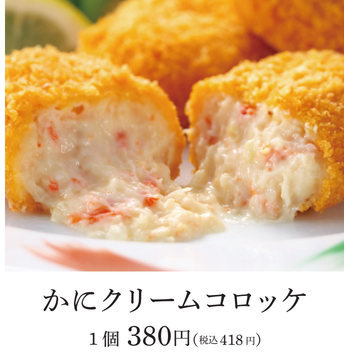
かにクリームコロッケ 1個 380円(税込418円)