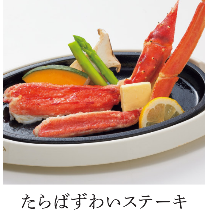
たらばずわいステーキ 3,500円(税込3,850円)