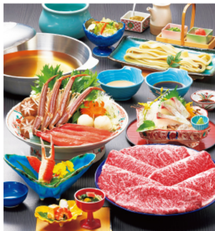
牛・かにしゃぶ会席 十勝 とかち 7,200円 (税込7,920円)