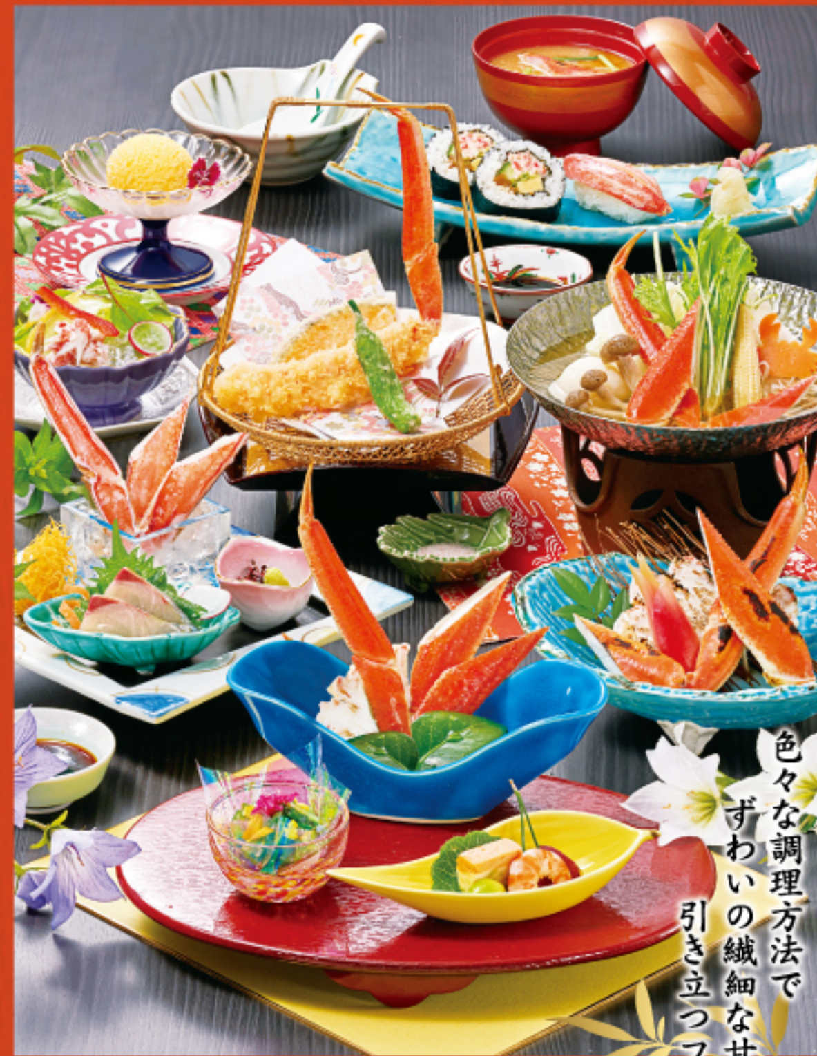
色々な調理方法で ずわいの繊細な甘み 引き立つフルコース