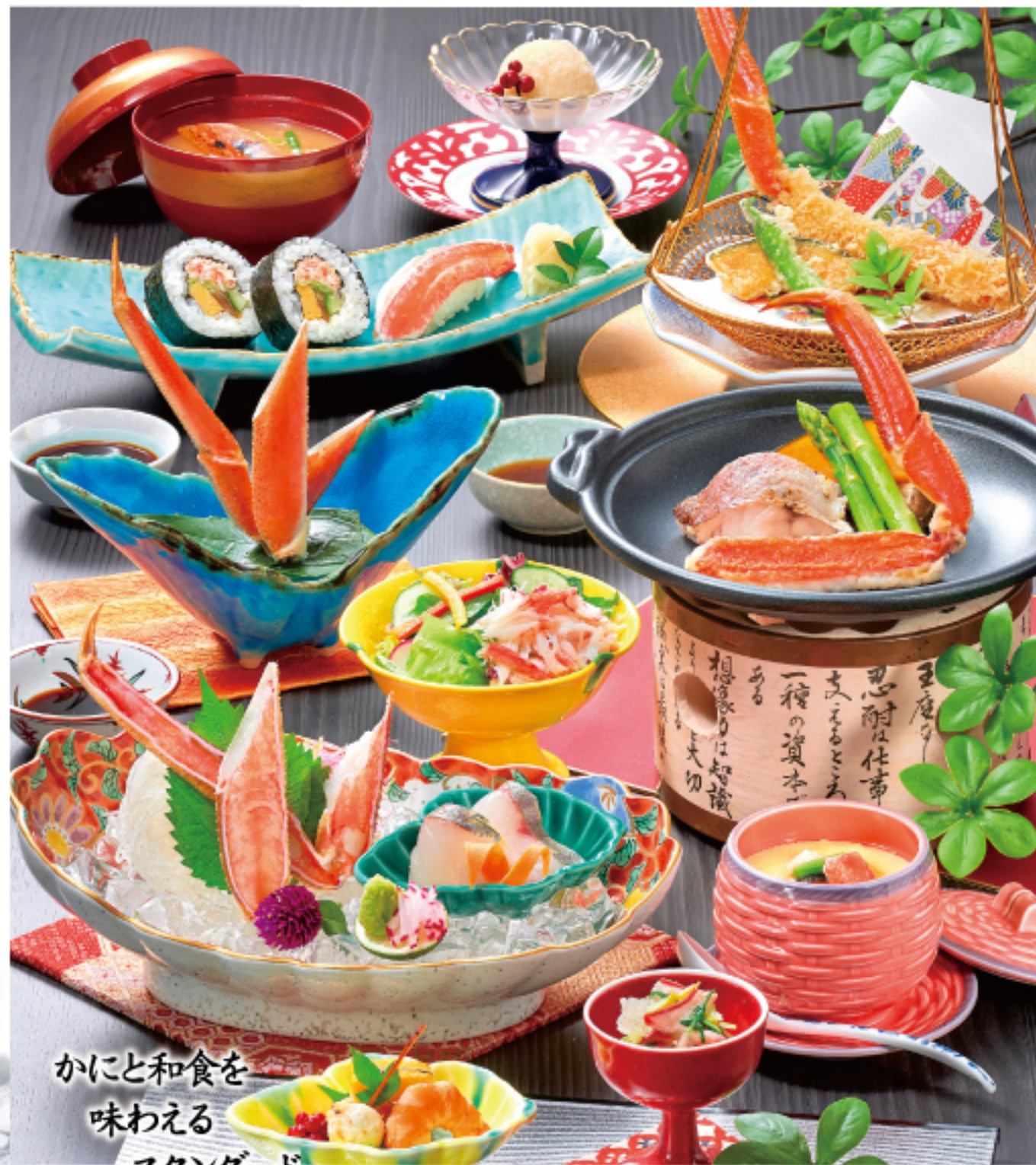
かにと和食を 味わえる スタンダード