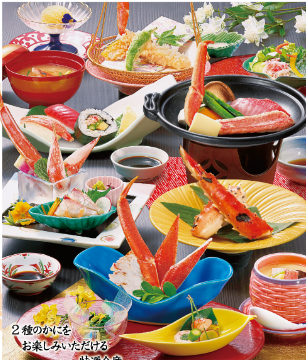
2種のかにを お楽しみいただける 特選会席