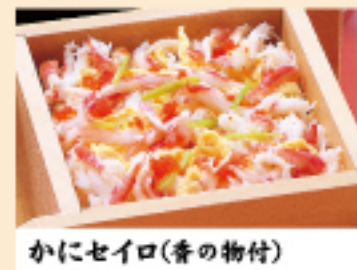
かにセイロ(香の物付)