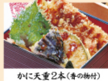
かに天重2本(香の物付)