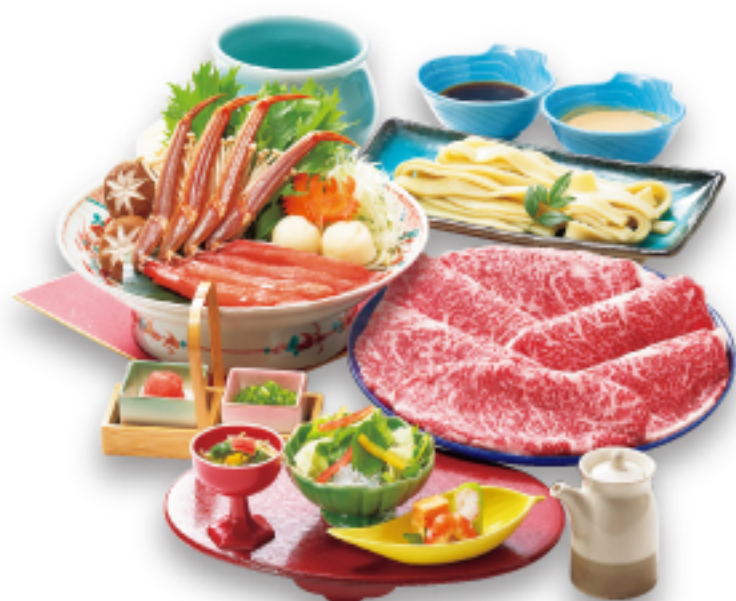
牛・かにしゃぶセット 6,200円 (税込6,820円)