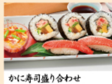
かに寿司盛り合わせ