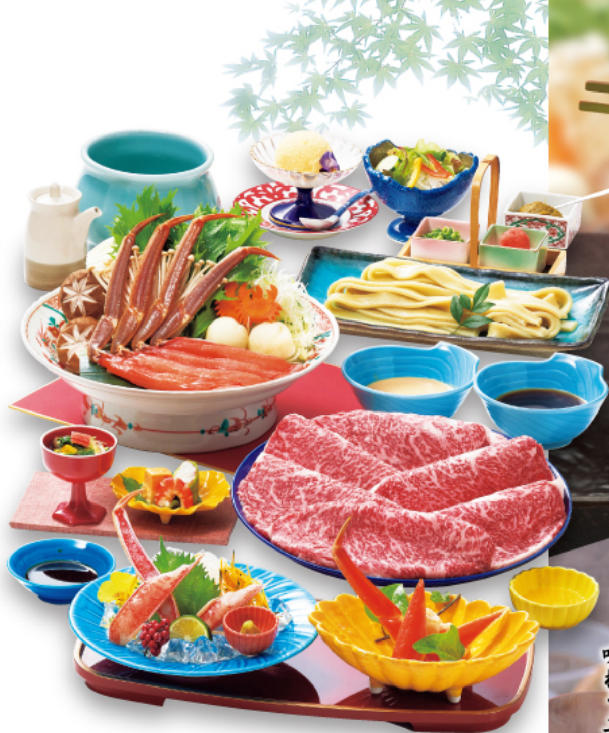
牛・かにしゃぶ会席 富良野 ぶらの 8,200円 (税込9,020円)