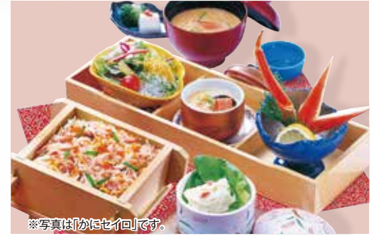
※写真は「かにセイロ」です。

●午後2時までの御用意となります。 ●1月2日(日)、3日(月)は 御用意致しておりません。