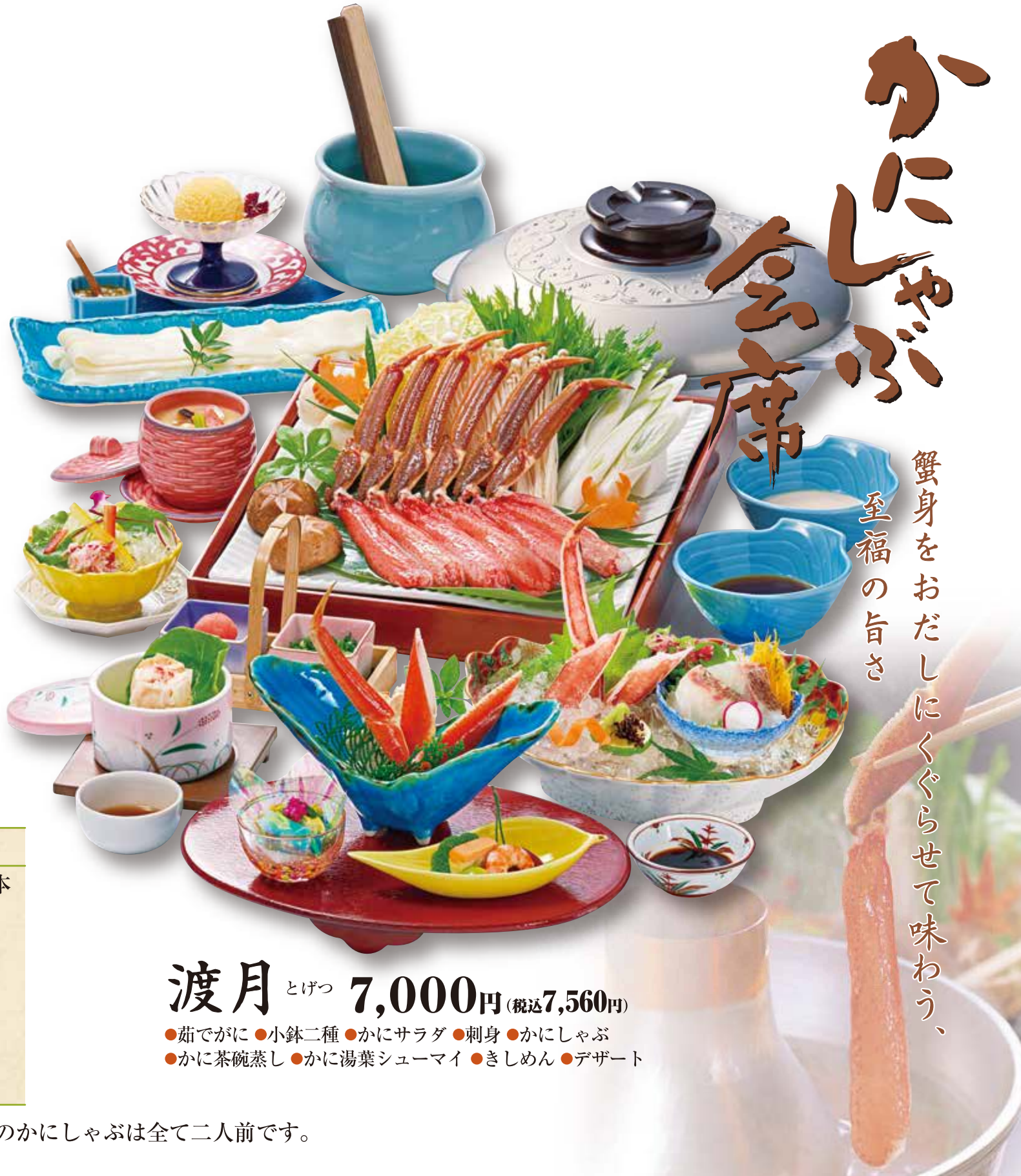
※写真のかにしゃぶは全て二人前です。