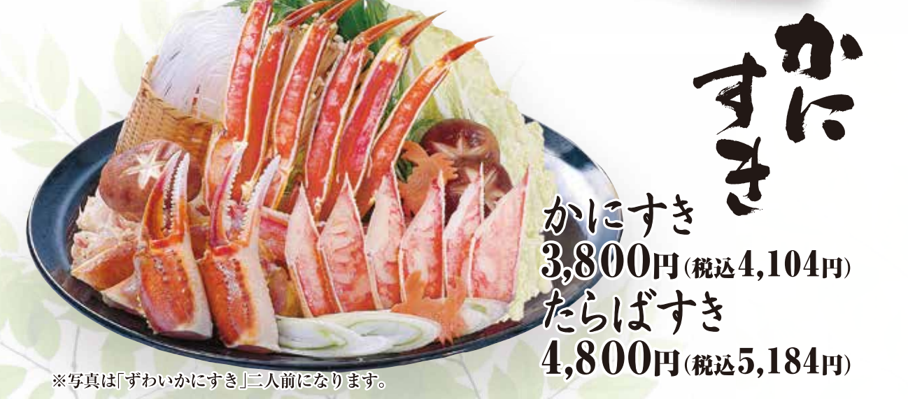
※写真は二人前になります。