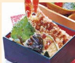
かに天重 (香の物付)