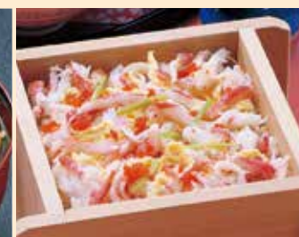
かにセイロ (香の物付)