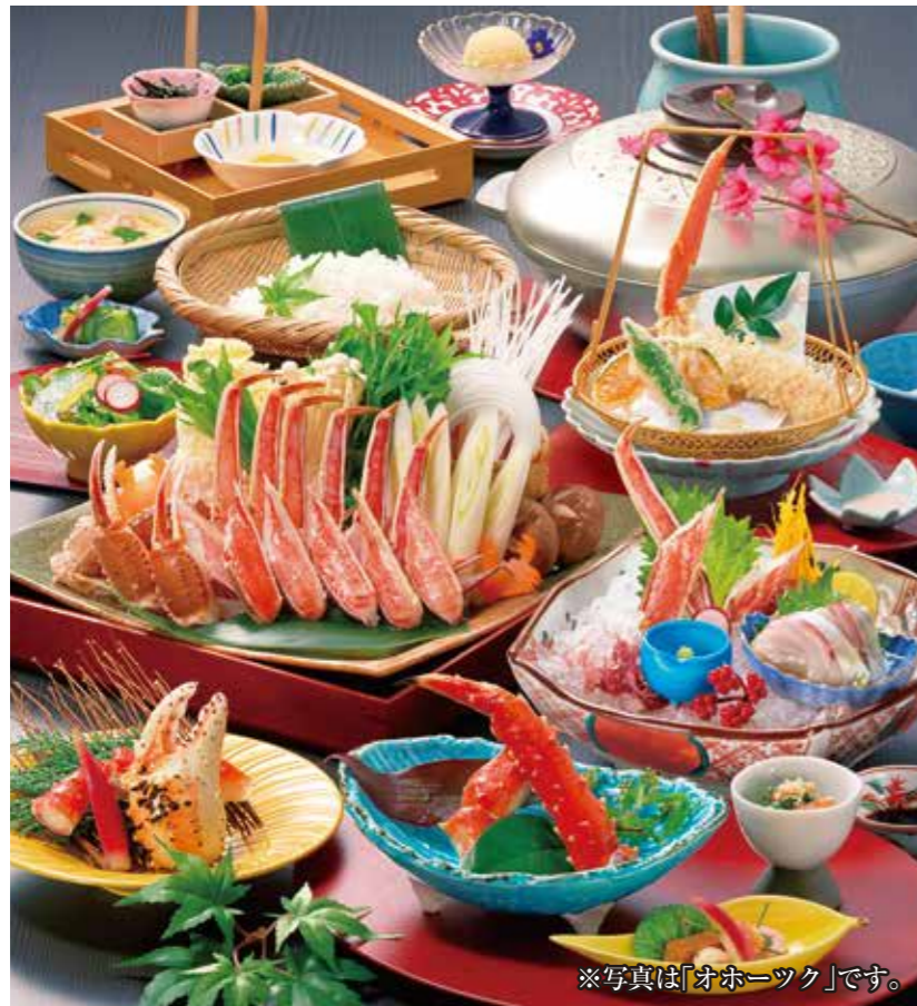
※写真は「オホーツク」です。